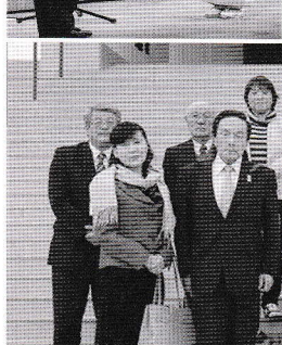
第六十八回 山形県・県民福祉大会