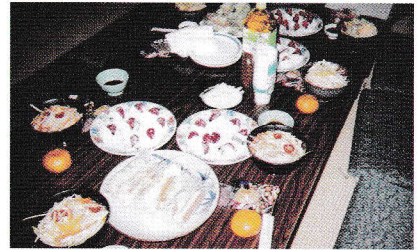
市母子会 料理教室

当母子会は県連の行事に参加や独自事業を実施しておりますので、一緒に「わが幸せは、わが手で」をモットーとして活動していきましょう。