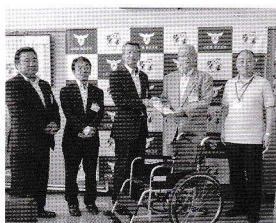
山形日産自動車株式会社様より車いすを寄贈していただきました