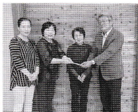
尾花沢地区婦人会様よりバザー売上金の贈呈がありました