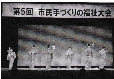
第5回 市民手づくりの福祉大会